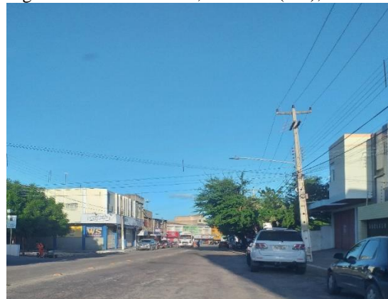
Figura 5. Hotel Caraúbas, Mossoró (RN), 2021.