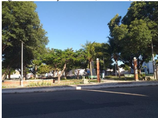
Figura 4. Rua Praça do Museu, Mossoró (RN), 2021.