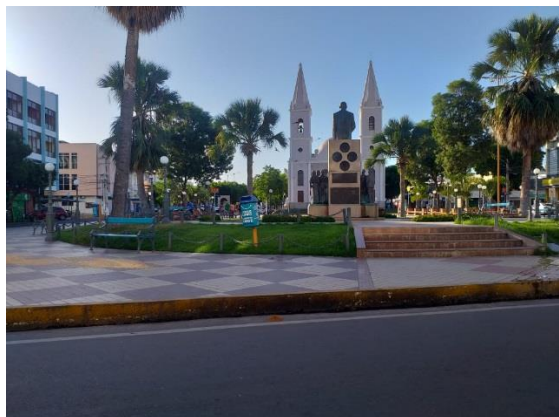
Figura 2. Praça da Catedral de Santa Luzia, Mossoró (RN), 2021.