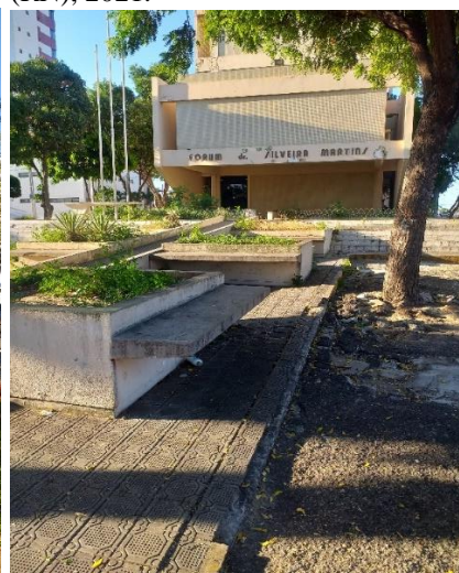
Figura 7. Praça do Fórum, Mossoró (RN), 2021.