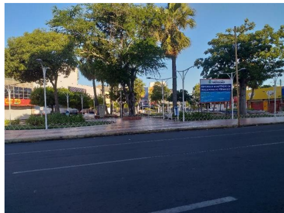
Figura 3. Praça do Pax, Mossoró (RN), 2021.