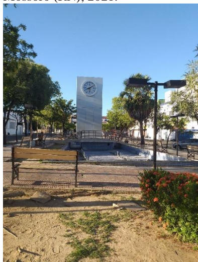
Figura 6. Rua -Praça do Relógio, Mossoró (RN), 2021.

movimentação de pessoas, sobretudo, à noite, nessa mesma localização encontra-se o antigo fórum da cidade, outro local de preferência das pessoas em situação de rua.