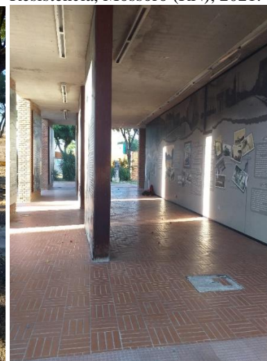
Figura 8. Memorial da Resistência, Mossoró (RN), 2021.